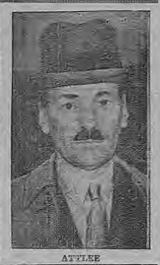
El Presidente Truman

WASHINGTON, 4. (P)—Eolentia—Truman y Attlee conferenciaron respecto de "la situación general del mundo" ante los graves acontecimientos del lejano Oriente habiendo durado la entrevista una hora y treinta minutos. La declaración conjunta decía que "la franca discusión había revelado su determinación de llegar a un entendimiento mutuo respecto de los graves problemas que se han presentado tanto al Reino Unido y a los Estados Unidos como a las demás naciones afiliadas a las Naciones Unidas". Añadió la declaración que "llegaron a un entendimiento respecto de su política exterior". El Primer Ministro y el Presidente volverán a reunirse mañana para almorzar y continuarán su discusión después.