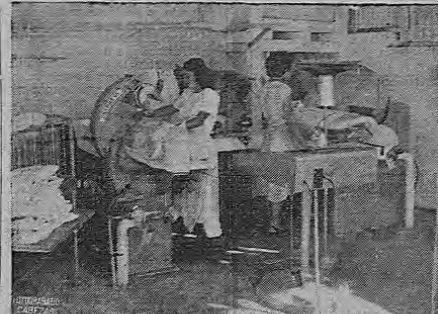
RAVAL Dry Clearing donde ya están instaladas las máquinas

Estas fotografías muestran el magnífico y modernísimo equipo UNIPRESS importado por RAVAL Dry Cleaning para su nuevo departamento de lavado de camisas.