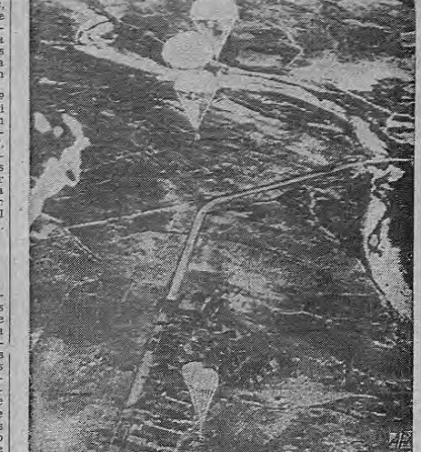
Paracaidistas llevan abastecimientos a la Infantería de Marina de los Estados Unidos que van de retirada defendiendo su retaguardia en la vecindad del "reservoir" de Chamjín, cerca de la frontera de la Manchuria. Véanse las tiendas de campaña de las tropas al fondo de la fotografía. Las tropas de Estados Unidos empezaron a abrirse paso después de haber sido rodeados por millares de comunistas chinos.