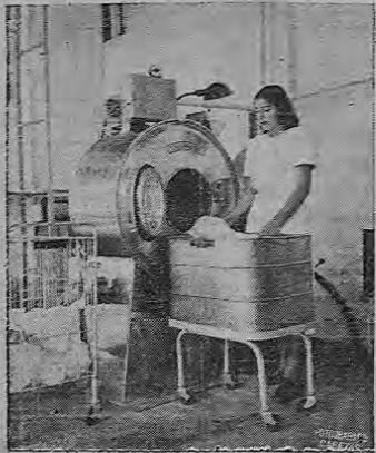
Estas dos vistas fueron tomadas en los talleres de la Empresa modernas y eficientes que aquí se muestran.

Nos place mucho ofrecer a nuestros lectores la buena noticia del establecimiento de este nuevo departamento que viene a mejorar mucho el servicio que se ha estado dando en la línea del lavado y aplanchado científico de toda clase de camisas. Esta es una verdadera especialidad en el ramo y ya era una necesidad muy sentida