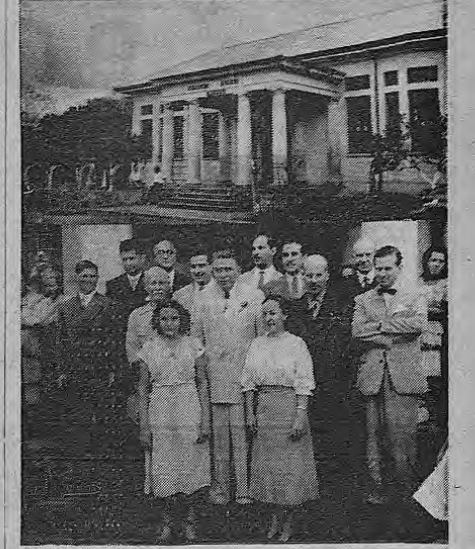
Desarrollando el retrato de "Almafuerte". — La bella Escuela de Barrantes de Flores. El Presidente de la República, los funcionarios de la Embajada Argentina y el personal docente de la Escuela Barrantes de Flores.

de fin de año. c) Reporte de autorización de trabajo en horas extra. d) Informe de labores por el mes de Octubre.