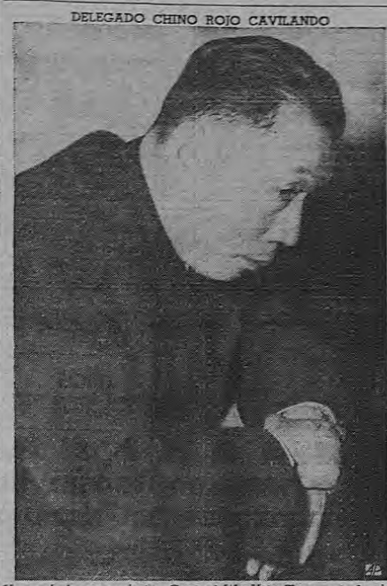
DELEGADO CHINO ROJO CAVILANDO

El sistema establecido exige la colaboración económica del gobierno o del pueblo interesado que solicita la ayuda y esta cooperación es la máxima garantía que puede ofrecerse a la Unesco de que el plan de ayuda técnica de que se trate responda a una verdadera necesidad de fomento económico y que la obra será de carácter permanente. La tramitación de las peticiones de ayuda se formaliza oficialmente por carta del gobierno interesado, dirigida al servicio de ayuda técnica de la Unesco fundamentando las razones y la necesidad del plan, e informado este favorablemente por la Unesco y aprobado por el Comité de Ayuda Técnica dependiente del Consejo Económico y Social, el plan entra a formar parte del programa de actuación de la Unesco para realización inmediata. Muchos países han solicitado la ayuda apenas han tenido conocimiento de las perspectivas y posibilidades que se abren por estos nuevos métodos de cooperación internacional. Ceylán, Indonesia, Libia, Ecuador, La India, Persia, Irak, Pakistán, Tailandia y Liberia constituyen el primer núcleo de pueblos que